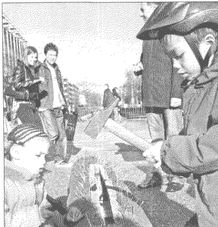
«Alle anders – alle gleich. Ich auch!» Kinder schlagen Nägel ein. / « Tous différents, tous égaux. Moi aussi! » Les enfants plantent leur clou dans l'œuvre de Gianni Vasari.