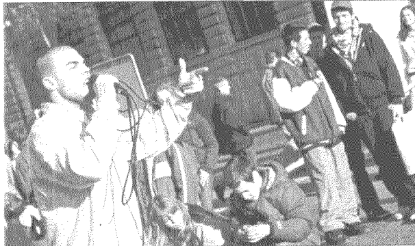
Rapper Oliftik protestiert singend gegen den Rassismus. Le rappeur Oliftik chante devant la caravane Stop au racisme.